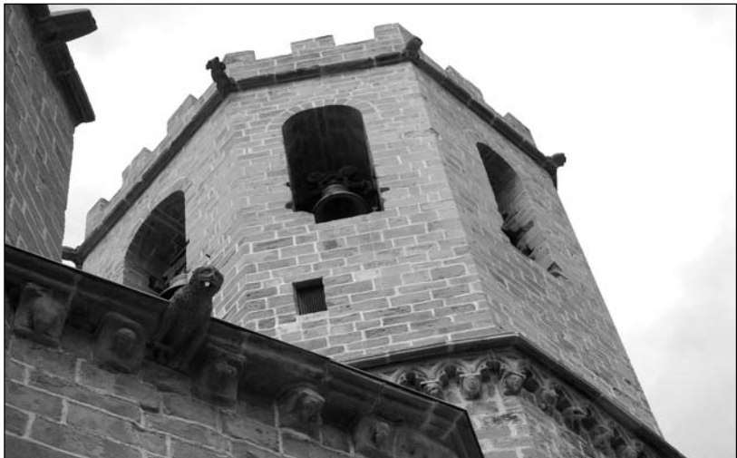
Torre octogonal de la iglesia de Valderrobres.

Una de las cosas que llama poderosamente la atención es el rosetón de forma triangular que existe en su cara nordeste o posterior y que sirve para iluminar la capilla doméstica ele-