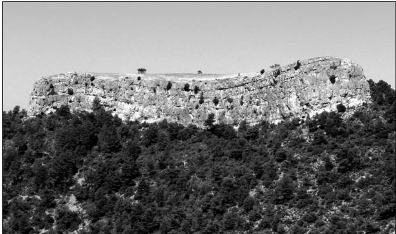
La Caixa, donde se llevaba a los animales enfermos para que sanasen.

Existe otro promontorio natural en esta comarca, situado sobre una de las montañas más altas, que con sus 1.033 metros de altitud es visible desde cualquier punto del entorno. Llamado popularmente ‘La Caixa’ o ‘El Arca’, su aspecto recuerda a una caja, dada su forma aparentemente rectangular, aunque el nombre original de esta gran roca es