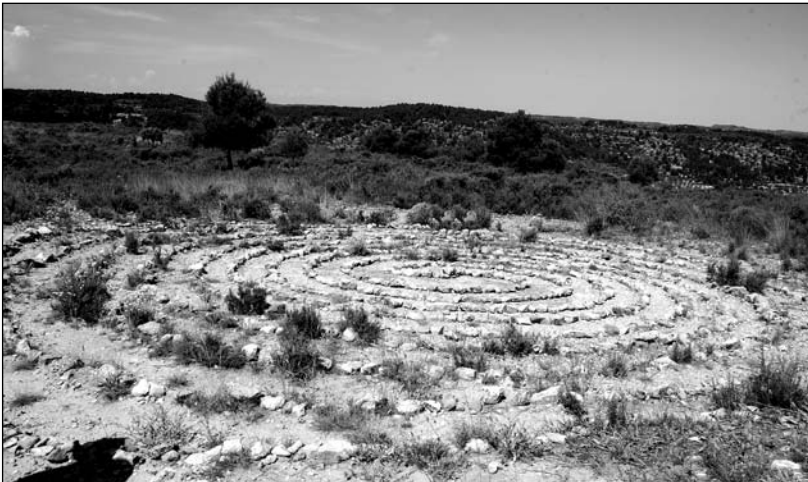
Alineación de piedras en el observatorio paleoastronómico de La Fresneda.

También en este mismo cerro se encuentra una ermita dedicada a Santa Bárbara construida en el año 1760. De dimensiones reducidas, posee una planta de cruz latina. El