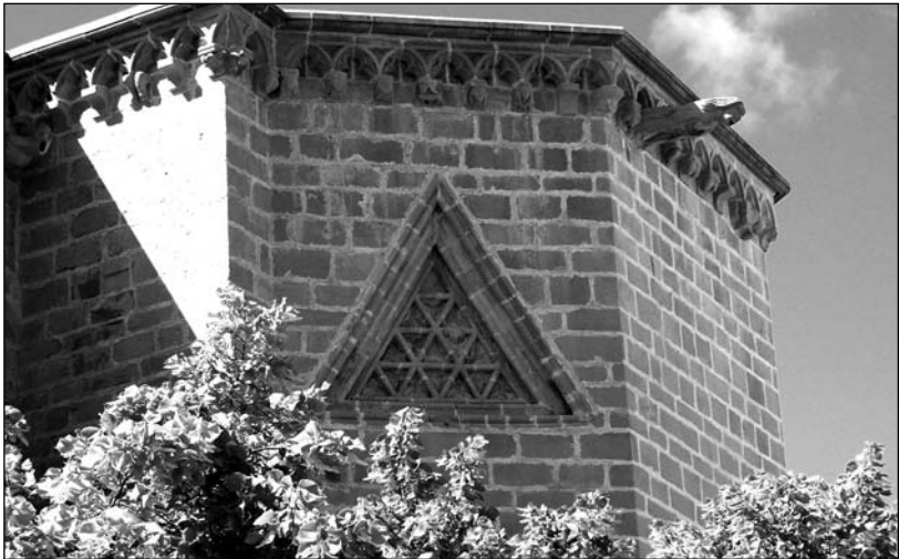
Rosetón triangular de la iglesia de Valderrobres.

Regresamos al rosetón triangular y, en contraposición a lo que hemos dicho antes, se puede interpretar con otra lectura, mucho más importante si pensamos que proviene de una cultura muy anterior. Es que el triángulo pudiera tener un origen helénico, conocido como la Tetraktys o el número diez para los Pitagóricos, pues en dicho rosetón está representado con la suma de los triángulos equiláteros que tienen el vértice