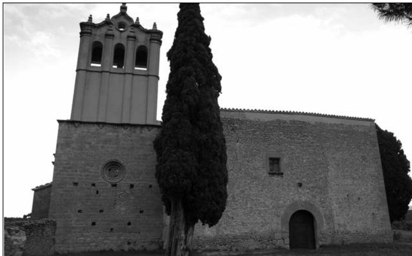
Iglesia de Monserrate, en Fórnols.

Al día siguiente, el clérigo descubrió que la imagen no se encontraba en el lugar donde la había depositado, al tiempo que el pastorcillo la volvía a encontrar de la misma forma y en el mismo lugar que el día anterior. El joven la recogió de