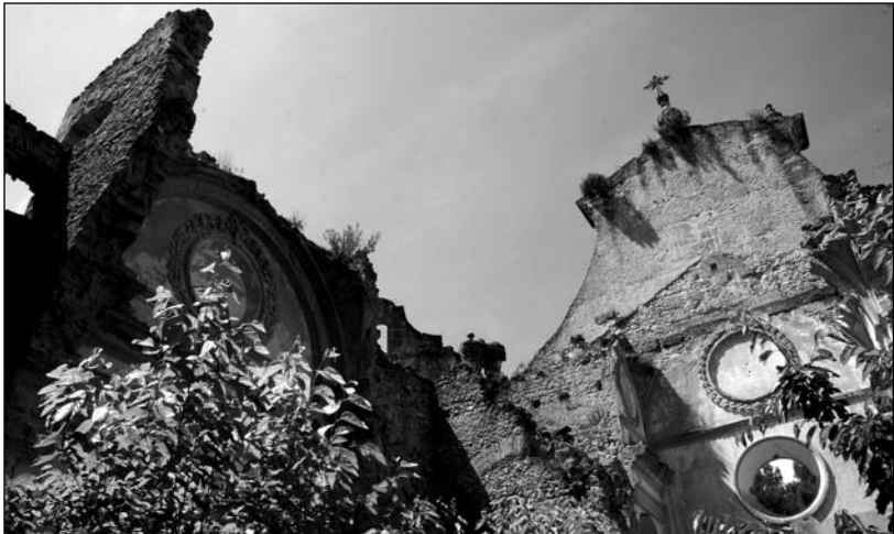
Ruinas de la iglesia que se edificó por la aparición de la Virgen.

En la actualidad, su estado es ruinoso, aunque conserva buena parte de su monumentalidad. También se puede acceder a la cueva donde tuvo lugar la aparición, que se encuentra por detrás de la iglesia.