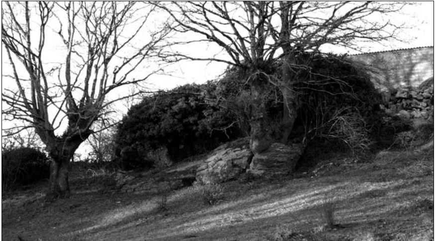
Campo de las apariciones de Pardellas.

Aún así, no me desanimé y emprendí una minuciosa búsqueda hasta el 31 de diciembre, e incluso fui un poco más allá, hasta junio de 1950. El resultado fue negativo pero fructífero. Sí, fue muy fructífero, porque me topé con dos noticias inesperadas y desconcertantes. Mira tú por dónde, las ediciones de “El Progreso” de los meses de agosto y octubre de 1949 se hacían eco de dos apariciones marianas que habían tenido como escenario las localidades de Santalecina (Huesca) y Thurn (Alemania). En ambos casos, al igual que en Pardellas, los videntes eran niños de corta edad y habían vivido su experiencia en pleno campo.... >