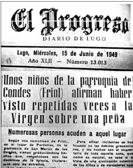
Titular de la noticia en “El Progreso”.

Cumplido el objetivo programado para aquella tarde, comenzamos a barajar fechas para visitar cuanto antes la parroquia de Condes. Finalmente, sorteados nuestros compromisos particulares, acordamos reunirnos en Friol quince días después, concretamente la tarde del primero de julio. Esta fecha tendría posteriormente para mí un significado muy especial.