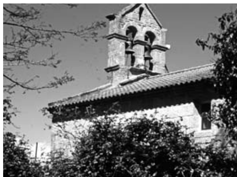
Santuario da Nosa Señora de Augasantas Cotobade, fonte cercana ao santuario, ponte nova de Cotobade, ponte de Pontesampaio, ermita de Santa Comba en Bértola (de esq. a dta. e de arriba a abaixo).

pouco se sabe, ten numerosas igrexas consagradas ás que se lles atribúen estrañas capacidades, como á de Bértola, no municipio de Vilaboa.