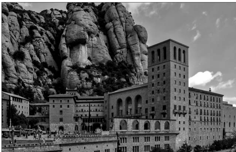
Vista exterior del monasterio de Montserrat (Barcelona).

Otra leyenda, más osada, nos cuenta que fue el mismo San Lucas evangelista quién esculpió la talla de la Virgen